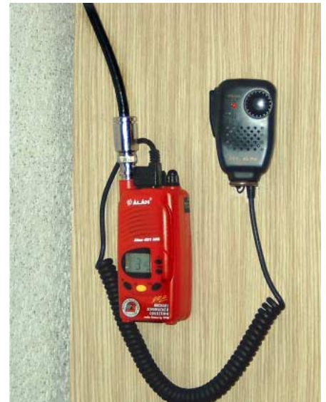
Das fertige PMR in Lauerstellung. Tipp: verschraubt man den Gürtelclip mit einer kleinen Strebe z.B. am Schrank, hält es wackelfrei und man kann das Gerät jederzeit per Dauerndruck bequem abnehmen.

handgeschnittene PMR-Anlage verursachen, könnte man bald wahrlich in der ersten Reihe sitzen! Jeder Betreiber einer solchen Sende-/Empfangsanlage haftet selbst und ganz allein für etwaige Störungen, die durch diese verursacht werden. Bernd Trampel