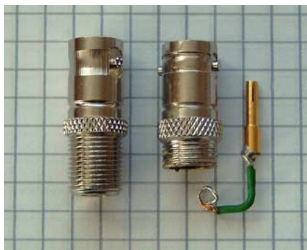
Die Arbeitsschritte im einzelnen: Original-Adapter; gekürzte Buchse; Mittenkontakt mit verlötetem Kabel.

Außer Kreuzschraubendreher, Drahtknipser, Rundfeile und einem kleinen Taschenmesser werden nur ein Lötkolben, Heißklebepistole und eine kleine Eisensäge bzw. Laubsäge mit feinem Metallblatt benötigt. Ein etwa drei Zentimeter langes Stück Draht oder Bastel-Litze und eine BNC-Buchse kommen zum Einbau noch hinzu.