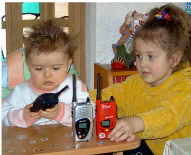
Zwei fleißige Helfer beim Präsentieren der Test-Sieger. Das Alan 451 und Alan 456.

Doch Vorsicht, auch was für den Umbau zugesagen ab Werk schon vorbereitet ist, kann ebenfalls beim HF-Test floppen! Derzeit werden oft Stations-Geräte in moderner Pultform angeboten. Dort braucht man nur das Gehäuse öffnen und die vorhandene Schwenkantenne gegen eine handelsübliche BNC-Buchse tauschen. Alles ohne Vorkenntnisse und Bohren, da es fast so einfach ist, wie das Wechseln der Batterien. Was nun folgt, schmerzt die Ohren, und die Original-