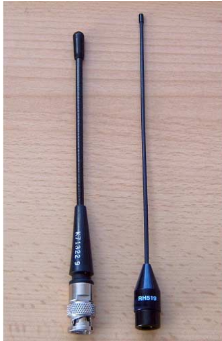
Links im Bild ein einfacher 1/4-Strahler für 70 cm; rechts die hochflexible RH519, die beste Leistungen auf 446 MHz bringt (Top!)

Ein zweistündiger Dauer-Belastungstest an dieser Antenne brachte keine Veränderungen im Verlauf des Betriebes – nicht einmal starke Erwärmung! Der vorher gemessene Stromverbrauch war in etwa gleich mit dem nach dem Umbau.