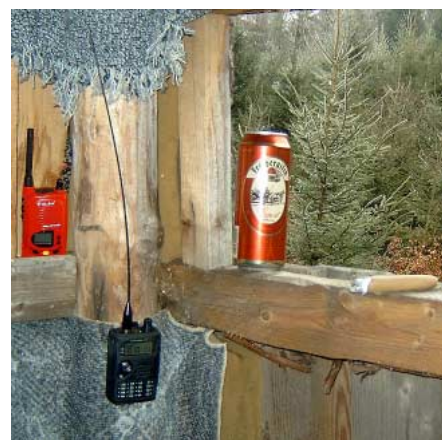
Der HF-Test ohne Eile in gemütlicher Atmosphäre auf einem hochgelegenen Jägerstand. Links das Alan 451; rechts daneben ein Handscanner auf Horchposten.

hierzu noch eine hochangebrachte Stationsantenne vorstellen, die dann mit der vielfachen normalen Empfangsfeldstärke das kleine Handy völlig übersteuern würde. Den abschließenden Eignungstest macht man am besten auf einer Bergkuppe nahe bewohntem Gebiet. Das zu testende Gerät auf SCAN stellen und eine ganze Weile so eingeschalten lassen, wobei man dazu ruhig paar Mal den Standort wechseln sollte.