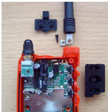
Zerlegtes Gerät; deutlich erkennbar ist die kleine Schraube der Antennen-Befestigung.

Die Befestigungsmutter passt sowieso nicht beim Einbau dahinter, deshalb wird alles geklebt – aber bitteschön mit Heißkleber! Beim BNC/F-Adapter hat der mittlere Bund eine Stärke von 11 mm und passt somit perfekt ins Gehäuse des Alan. Von diesem oberen Rändelsteg werden nun in Richtung Gewinde acht Millimeter abgemessen und unter ständigem Drehen der Rest vorsichtig abgesägt. Hier braucht nur der Metallrand aufgesägt zu werden, da der Plastikeinsatz dann leicht herausrutscht. An dieser Stelle NICHT die gesägte Fläche entgraten oder gerade feilen. Dieser raue Rand verleiht beim späteren Einkleben mehr Halt, da wie gesagt keine Mutter dahinter kommt. Nun den kleinen Messingkontakt aus der Mitte herausziehen und in diesen