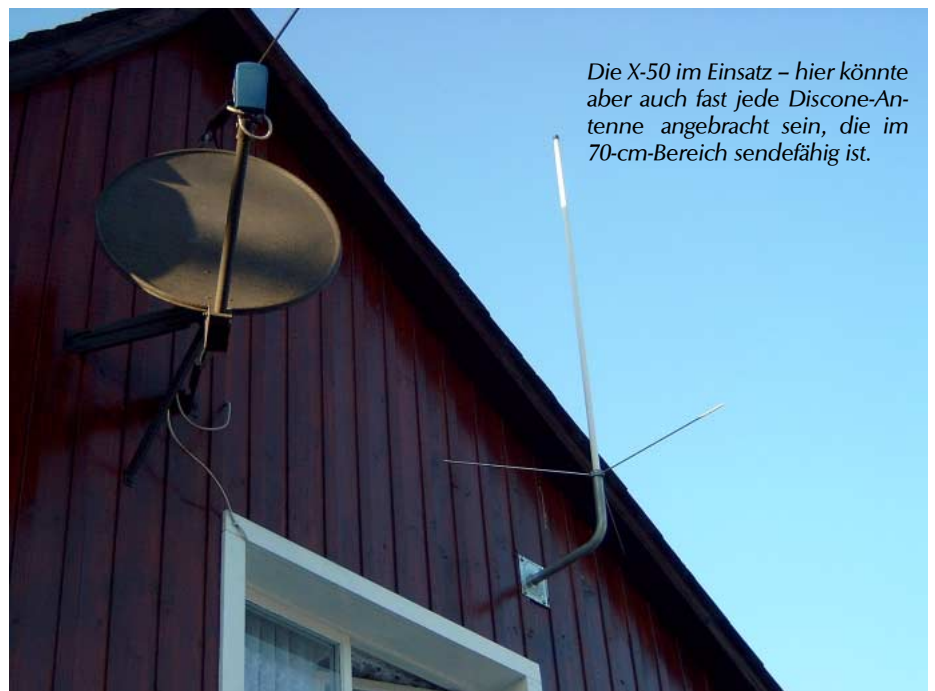
Die X-50 im Einsatz – hier könnte aber auch fast jede Discone-Antenne angebracht sein, die im 70-cm-Bereich sendefähig ist.

Anfragen beantwortet der Autor gerne unter funksurfer@freenet.de